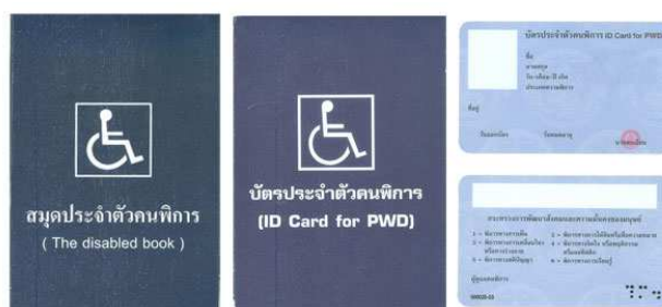
ตัวอย่างบัตรและสมุดประจำตัวคนพิการ

หมายเหตุ : กรณีได้รับเบี้ยยังชีพคนพิการอยู่แล้วและได้ย้ายเข้ามาในพื้นที่ ตำบลตะคร้ำเอนจะต้องมาขึ้นทะเบียนที่ อบต.ตะคร้ำเอน เพื่อใช้สิทธิรับเงินเบี้ยความพิการต่อเนื่อง.....ค่ะ